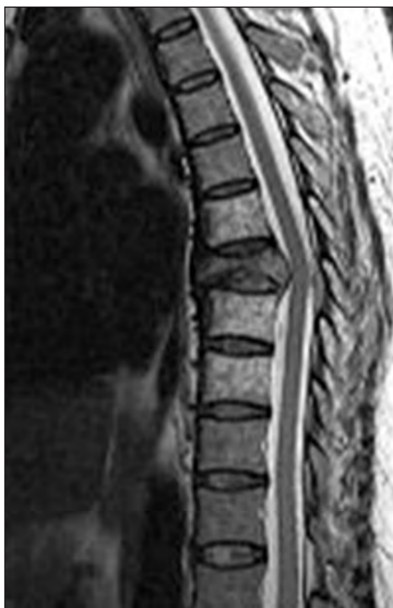
Figura 3. Metástasis ósea a nivel de T7 con compresión medular.

El dolor de la metástasis ósea vertebral está presente en alrededor de 85% de los pacientes y suele ser progresivo, lento y duele por las noches.