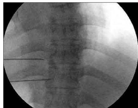
Figura 5. Visión fluoroscópica anteroposterior donde se observan cánulas de radiofrecuencia en espacio paravertebral (21).

Oh et al (21) publicaron una serie de 100 pacientes con dolor de pared torácica secundario a cáncer, donde realizaron radiofrecuencia termal (80-90°C) a los nervios espinales torácicos, usando cánulas de radiofrecuencia no traumáticas para obtener parestesias a estimulación sensitiva (50 Hz, 0,5 V) bajo fluoroscopia.