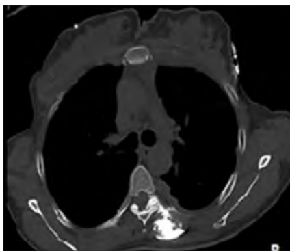
Figura 4. Se observa difusión del medio de contraste hacia el espacio paravertebral, foraminal y epidural (20).

Carolina Hernández et al (20) realizaron un ESP con fenol al 6% diluido con medio de contraste en un paciente con cáncer pulmonar logrando una disminución del dolor torácico desde un EVA 8 a EVA 2. El volumen total fue de 12 ml inyectado en bolos pequeños, y al TAC se observa difusión paravertebral, foraminal y peridural (Figura 4). La paciente presentó dolor tipo quemadura en sitio de inyección que fue controlado con analgésicos no esteroideos.